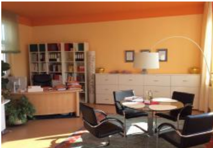
Rechtsanwaltskanzlei Wipper in Büdingen

Beginnen sie am Eingang. Ist er leicht zu finden? Sind der Name der Straße und die Hausnummer günstig für ihr Unternehmen? In einer Goldgasse das Büro zu haben ist von vornherein günstig, die Hausnummern 1, 2, 3, 8 oder 9 ebenso. Wie ist die Parkplatzsituation? Findet man sie leicht oder hat das Chi es schwer zu ihnen zu kommen? Richten sie sich zunächst hell ein. Mit lichten Farben und schönen Formen, die der Seele schmeicheln. Die der Tür gegenüber liegende Wand sollte in jedem Fall einen Eyecatcher bekommen, einen roten Punkt oder ein schönes Bild, Blumen oder eine Skulptur, die lebensbejahend, ja geradezu aufbauend wirkt.