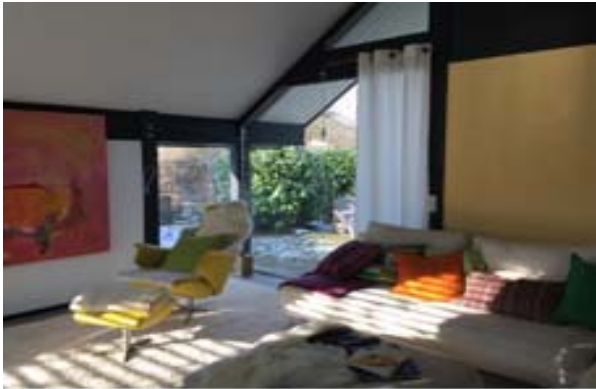
Nach der Feng Shui Beratung

bestand die Notwendigkeit die Sitzmöbel durch einen Teppich zu verbinden, um so Einheit und Harmonie zu schaffen.