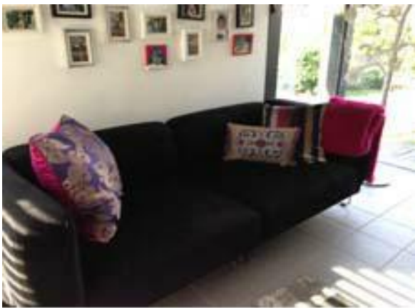
Vor der Feng Shui Beratung

Der Südwestbereich einer Wohnung oder eines Hauses entspricht in seiner Energie dem Trigramm Kun. Wir sprechen hier vom Bereich der Partnerschaft. Die Energie ist erdig. Farben wie Rot, Gelb, Cremeweiß und Orange stärken die Energie des Raumes. Schwarz entspricht der Energie des Wassers. Wasser und Erde sind zwei Energien, die im Widerstreit liegen, weshalb es sich hier von selbst verbietet, dass eine schwarze Couch im Südwesten platziert wird.